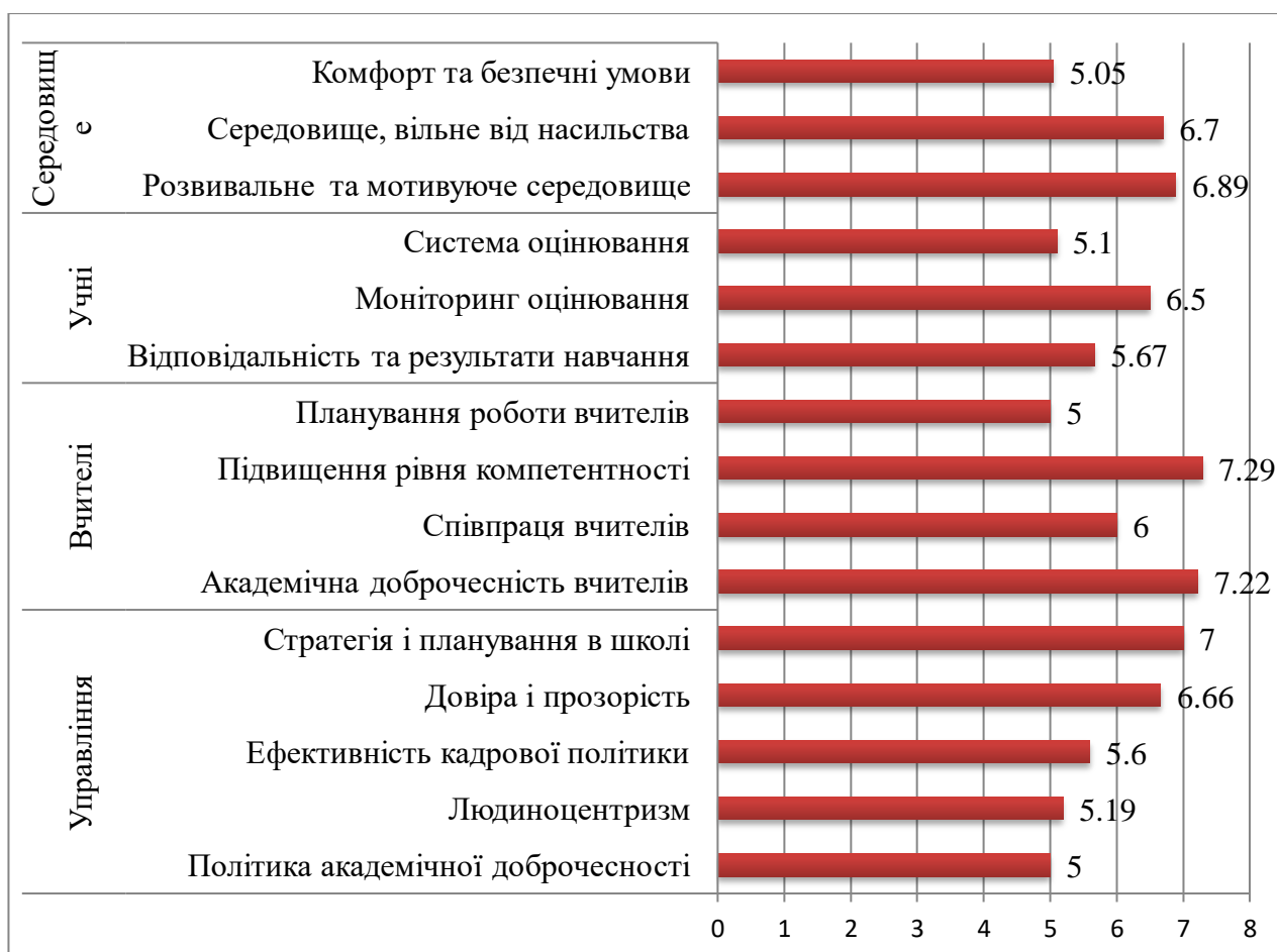
Рис. 4. Результати моніторингу якості освіти за 2020/2021 навчальний рік

У травні-червні 2021 року було проведено комплексне самооцінювання за чотирма напрямками. Результати комплексної оцінки показали високий рівень освітньої діяльності (додаток 8).